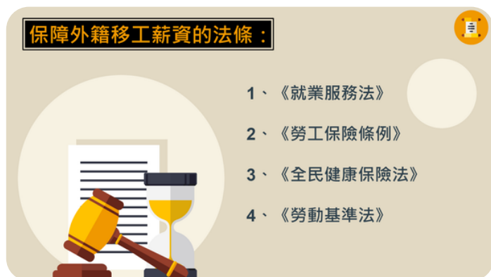
圖三、外籍移工適用法條

因從網路新聞了解了有關外籍移工的議題後，發現看護和雇主間的摩擦，甚至發現有些看護會莫名其妙的消失，這些情況背後的原因都讓我們十分好奇，且又對法政學群有相當的興趣，所以便想藉由彈性的自主學習時間，撰寫一篇小論文研究，探究高中生對於外籍移工薪資問題的認知度和認同度，除了能夠一起深入接觸法政相關領域外，還能夠藉此讓更多人關心這些異鄉人的相關議題。