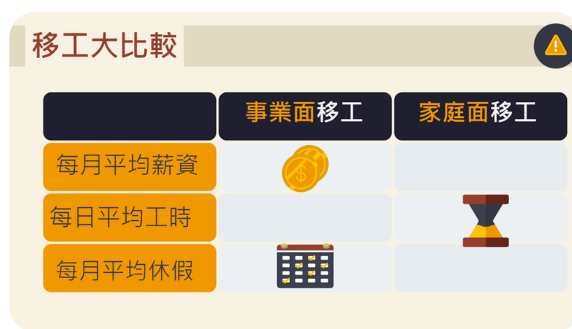
圖四、外籍移工種類比較